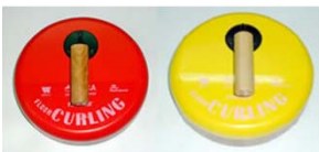
フロッカーストーン