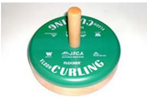
フロッカーターゲットストーン